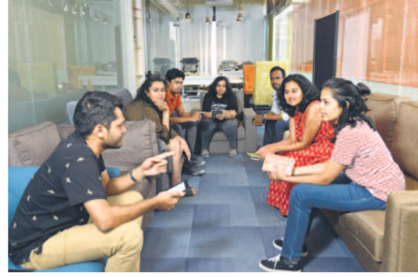
From curated member lists to by-invitation-only access, a new generation of private social clubs is redefining exclusivity.

"Offline's got a powerful address book of founders in the country who are ready to